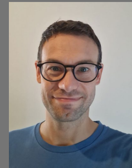
FOTO DELLO STROKE TEAM DA INSERIRE QUI